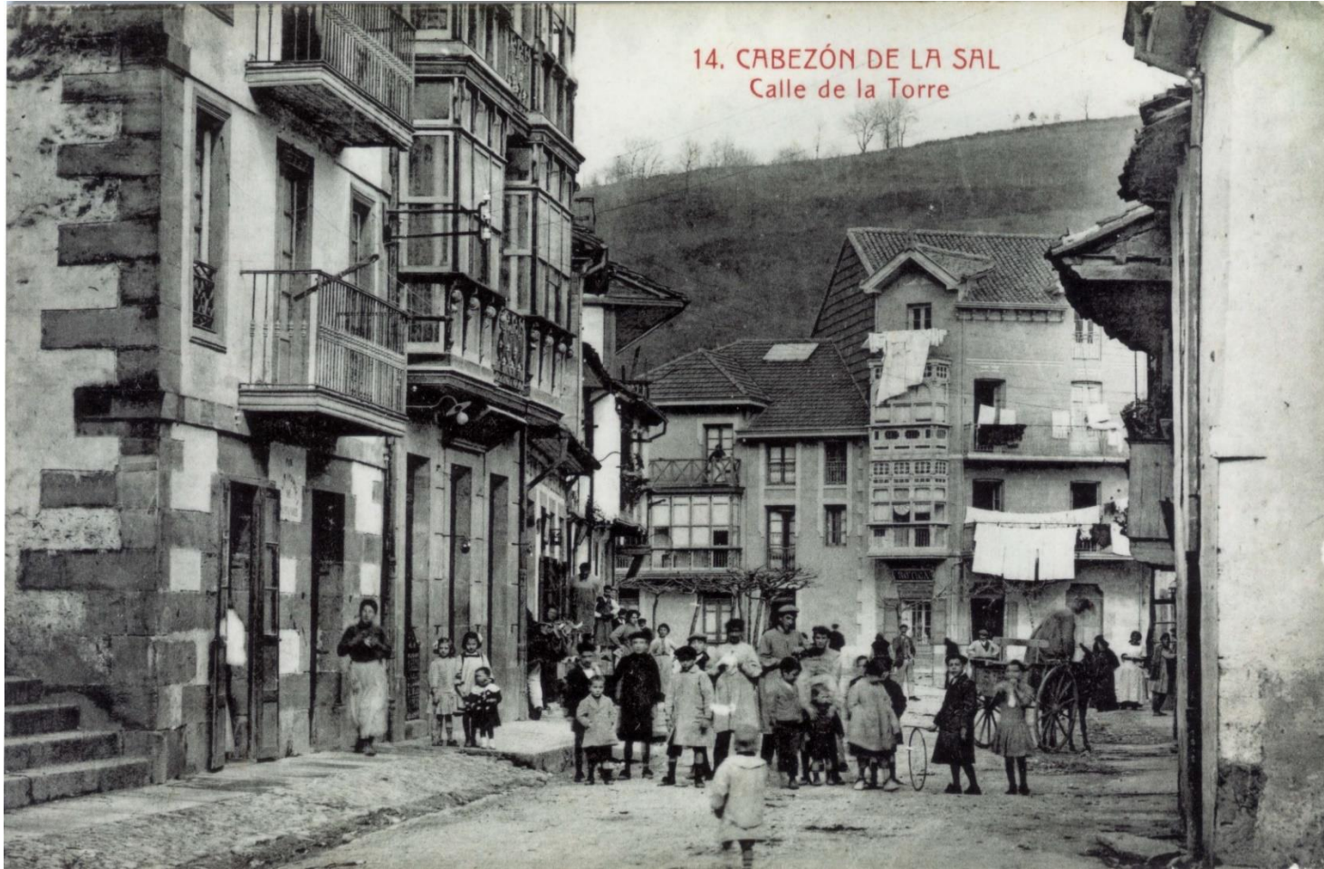
14. CABEZÓN DE LA SAL Calle de la Torre