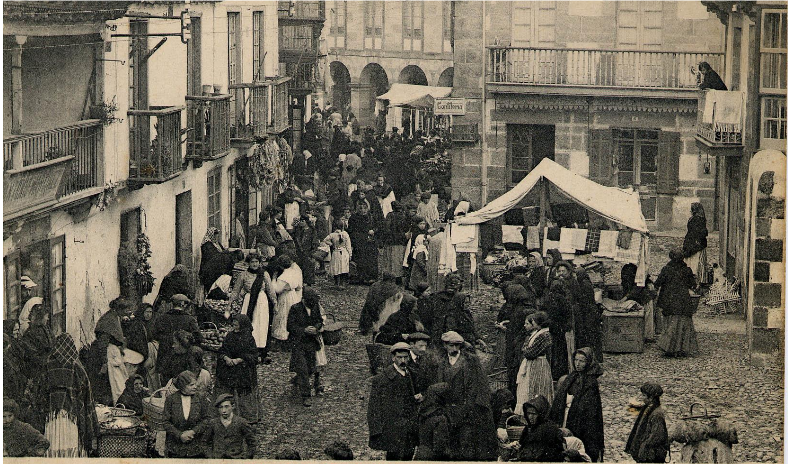
12. CABEZÓN DE LA SAL — Plaza del Mercado