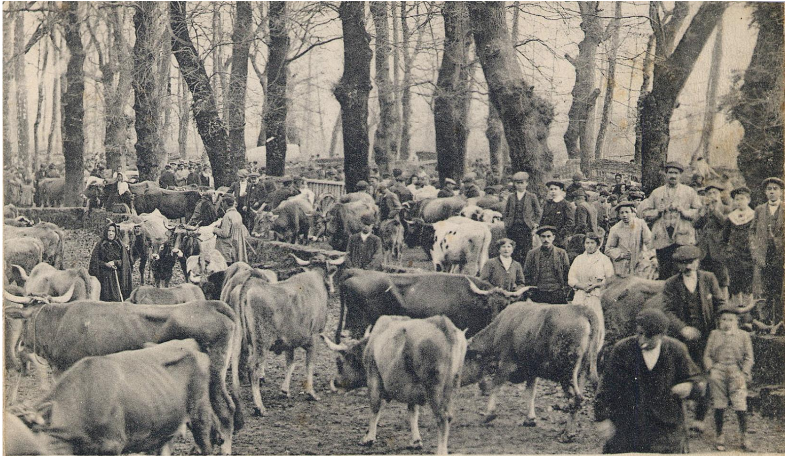
2. CABEZÓN DE LA SAL — Ferial de La Losa