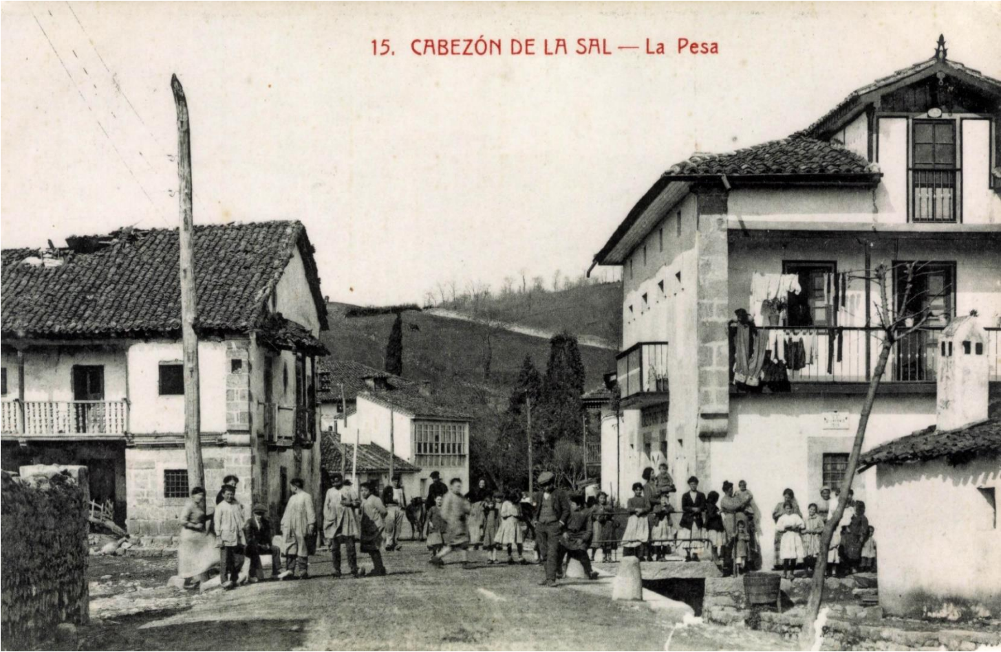
15. CABEZÓN DE LA SAL — La Pesa