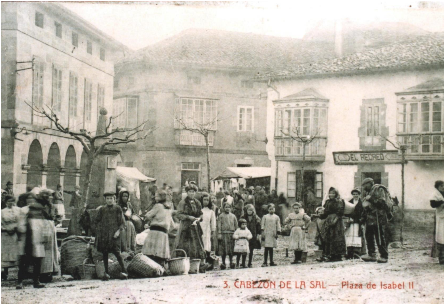
3. CABEZON DE LA SAL — Plaza de Isabel II