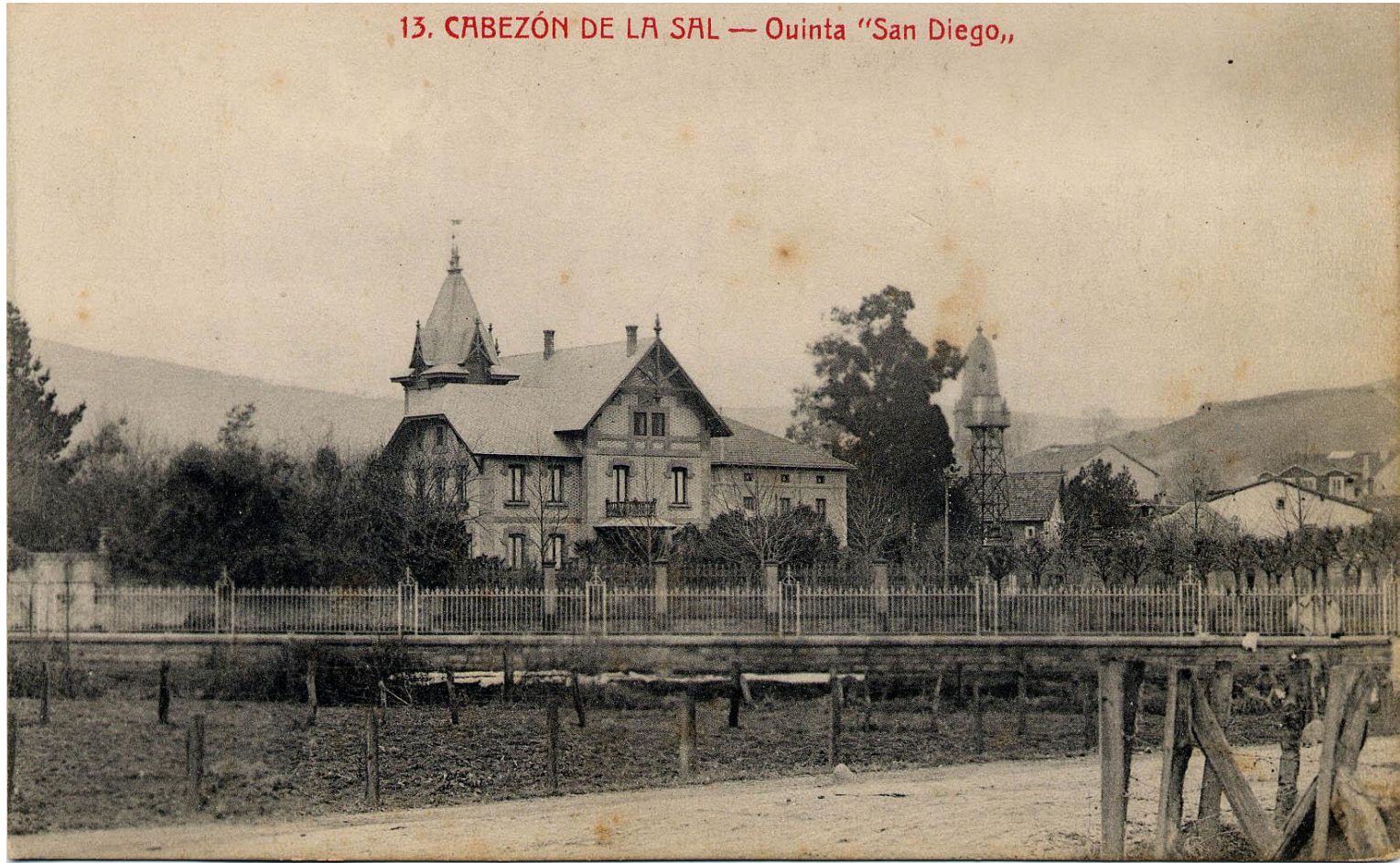
13. CABEZÓN DE LA SAL — Quinta "San Diego,,