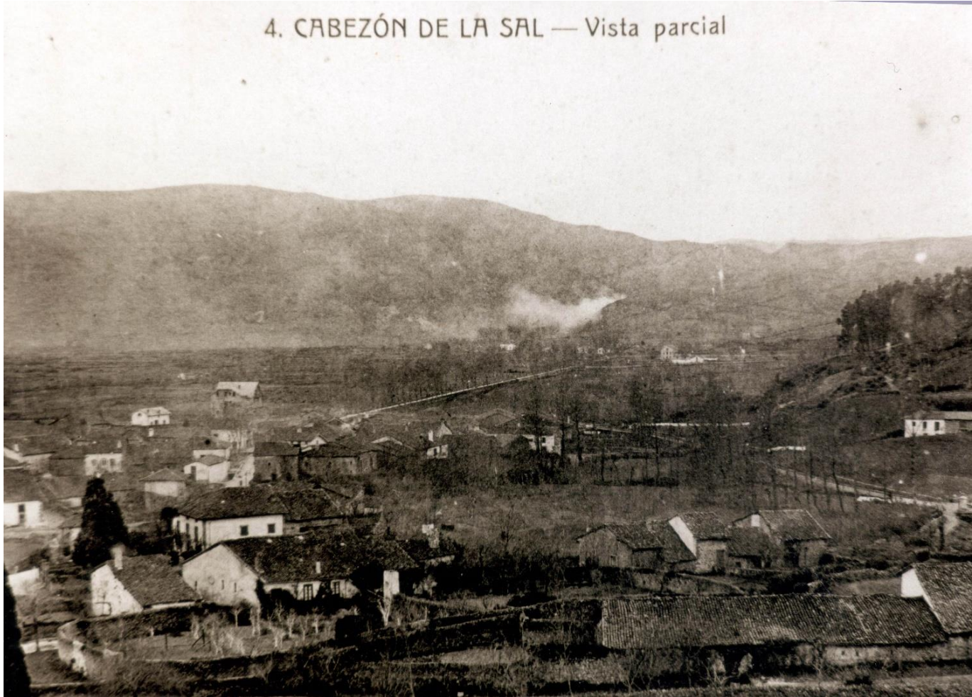
4. CABEZÓN DE LA SAL — Vista parcial