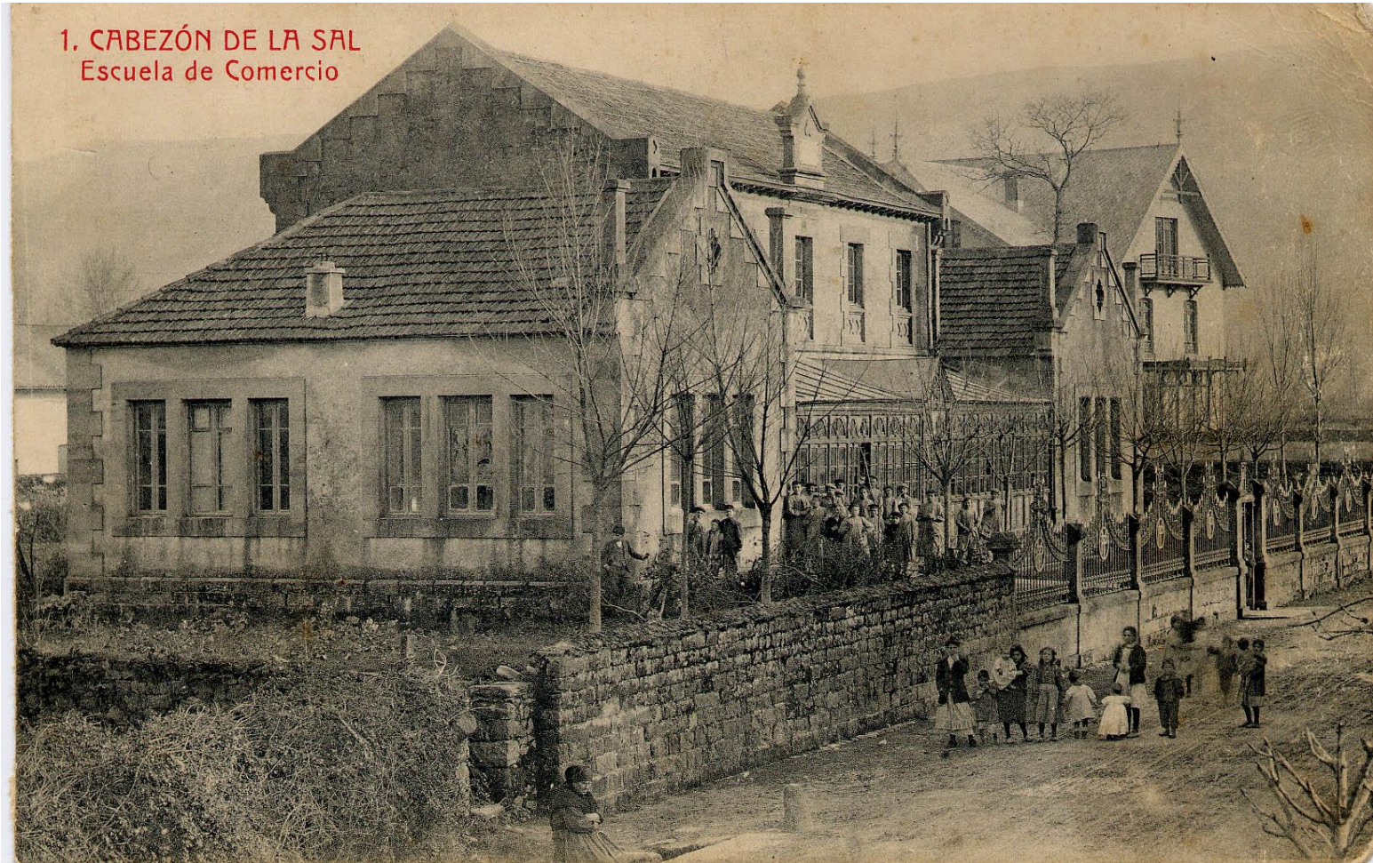
1. CABEZÓN DE LA SAL Escuela de Comercio